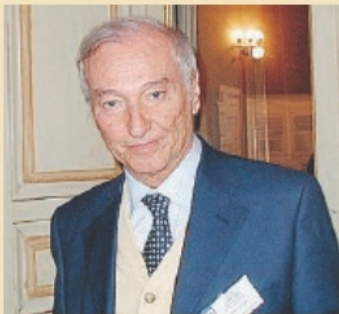
Il giornalista Piero Angela

A Piero Angela sarà assegnato questa sera nella Casa Cava di Matera il premio “I Sassi d’Oro” alla carriera, kermesse dedicata al cinema e al mondo della produzione cinematografica.