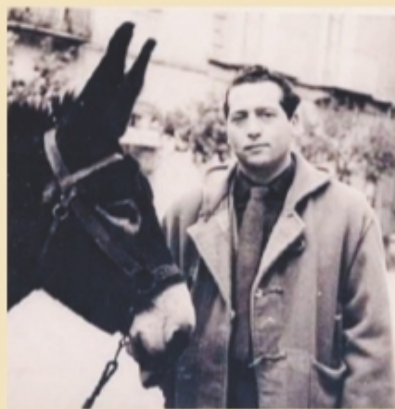
IL LETTERATO Il poeta Rocco Scotellaro