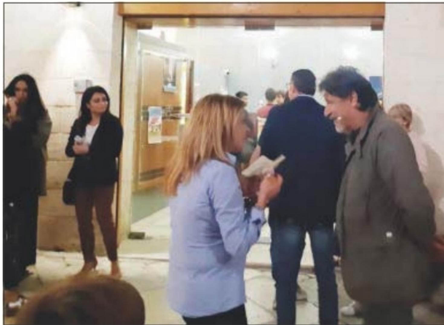
L'attore e regista Giorgio Tirabassi a Matera

Si tratta di una commedia divertente, dove lo stesso attore-regista trasferisce sul grande schermo alcuni dei personaggi che aveva già portato con gran successo a teatro. Il film, preceduto da un incontro con lo stesso regista e con l'attrice Roberta Mattei, è stato presentato giovedì sera al cinema "Il Piccolo" a Matera. L'iniziativa è stata inserita nell'ambito de "I Sassi d'Oro: impresa, doppiaggio e cinema", la manifestazione culturale nata per promuovere e valorizzare lo spettacolo e i mestieri legati all'impresa cinematografica, al mondo della post-produzione, del doppiaggio e delle politiche sociali e del lavoro. I modelli presi in considerazione in fase di sceneggiatura, firmata dal neo-regista assieme a Mattia Torre e Daniele Costantini, sono quelli di un cinema, che rimanda alla stagione della commedia all'italiana, da Steno a Monicelli, da Risi a Citti. Protagonisti della pellicola sono i quarantenni Rufetto e Nello, due ladri di "seconda clas-