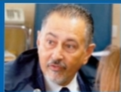
Pittella a pagina 3

Pittella chiede, senza ottenerlo, di andare a lavorare al San Carlo... gratis