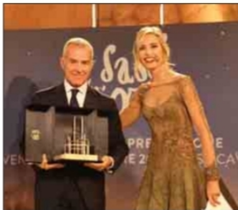
A condurre la serata il volto di Rai Italia, Monica Marangoni

MATERA - L'evento che si è celebrato a Matera, capitale europea della cultura, ha richiamato a Casa Cava numerosi personaggi di spicco. Una serata pensata da un altissimo livello cultura per premiare quanti lavorano nell'impresa cinematografica, il "dietro le quinte", per occuparsi di impresa audio visiva di doppiaggio e di tutto quanto ruota attorno al settore della post produzione. A condurre la serata la magnifica Monica Marangoni il volto di Rai Italia, l'Italia all'estero che ha conquistato da subito il suo pubblico, ad accompagnarla una madrina d'eccezione Roberta Giarrusso. "I Sassi d'Oro" ha raccontato della partnership che vedrà presto l'internazionalizzazione del premio con dell'Italian Movie Awards, il Festival del Cinema Italiano all'estero, che si terrà a New York il prossimo 19 novembre