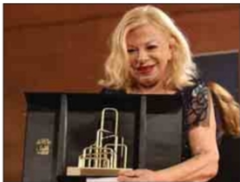
Alcuni dei riconoscimenti assegnati nelle passate edizioni della kermesse