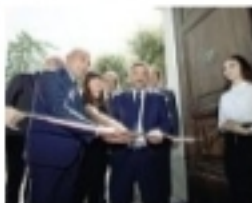
Un momento dell'inaugurazione di ieri a Matera

Negli ambienti allestiti presso lo storico Palazzo della Provincia, a pochi metri dall'area dei Sassi, è stato inaugurato lo Spazio Campania a Matera. L'assessore regionale al Turismo, Corrado Matera, ha tagliato il nastro della struttura destinata ad accogliere eventi turistico-culturali nell'ambito di Matera 2019. Erano presenti il presidente della Provincia Piero Marrese, l'assessore comunale al Turismo e agli Eventi Mariangela Liantonio, il presidente della Fondazione Matera 2019 Salvatore Adduce, il direttore dell'Agenzia regionale per il Turismo della Regione Campania, Luigi Riala e il coordinatore dei Di-